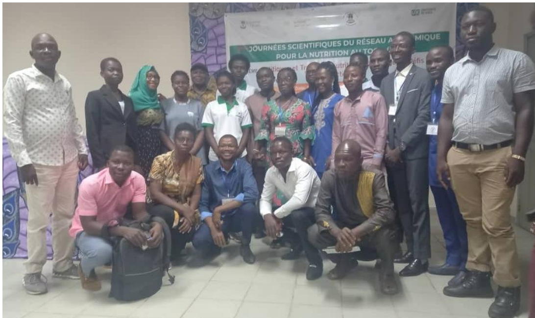
Photo de famille à la fin des JSIRI