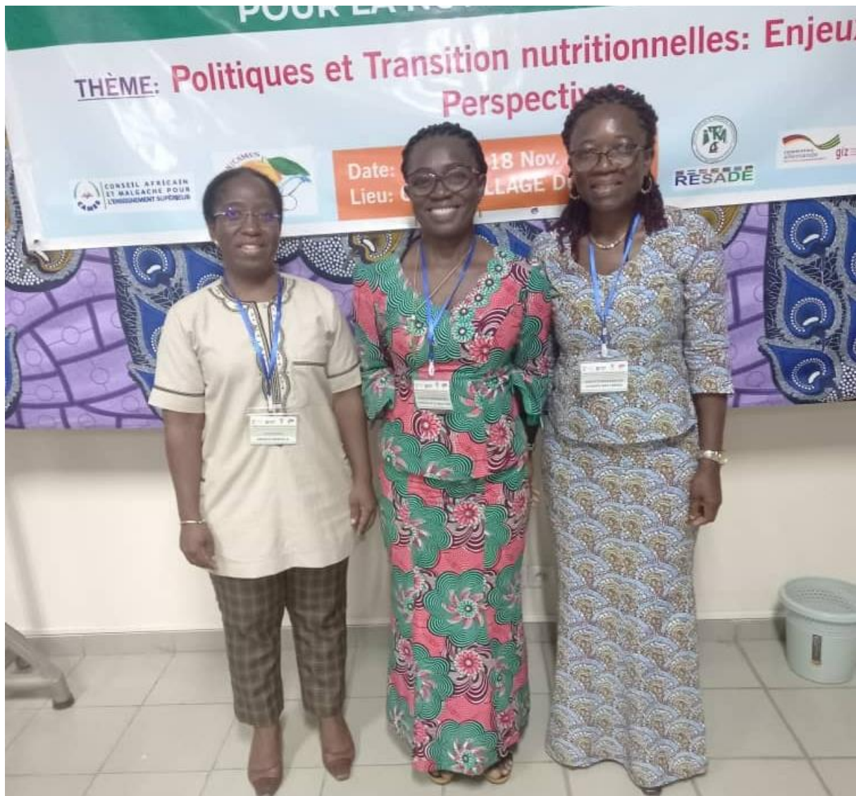
Photo de groupe à la fin des JSIR1