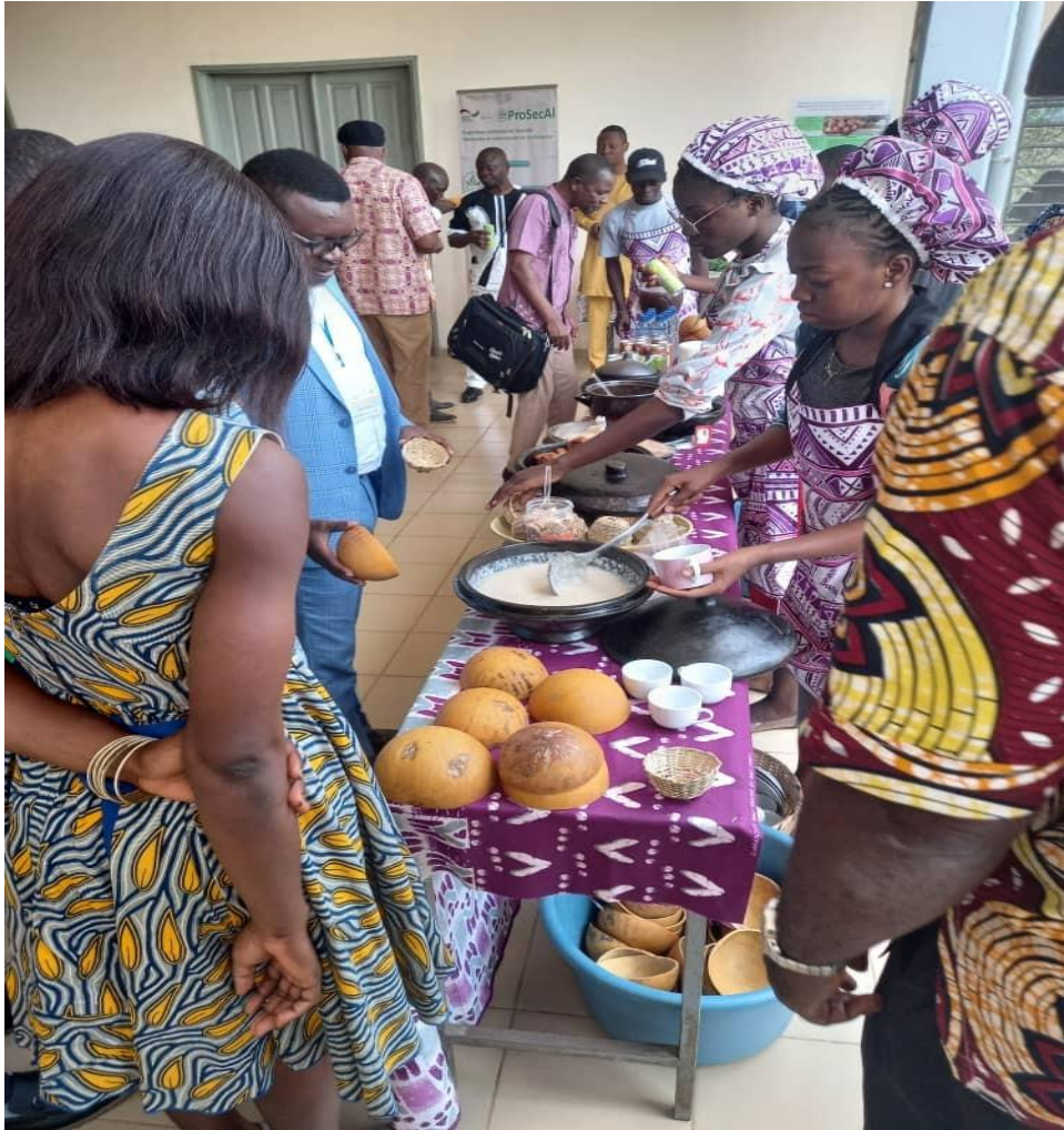
Dégustation de repas Togolais