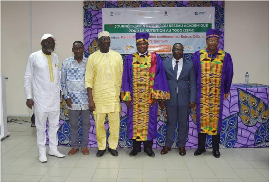
Photo de groupe après la cérémonie d'hommage