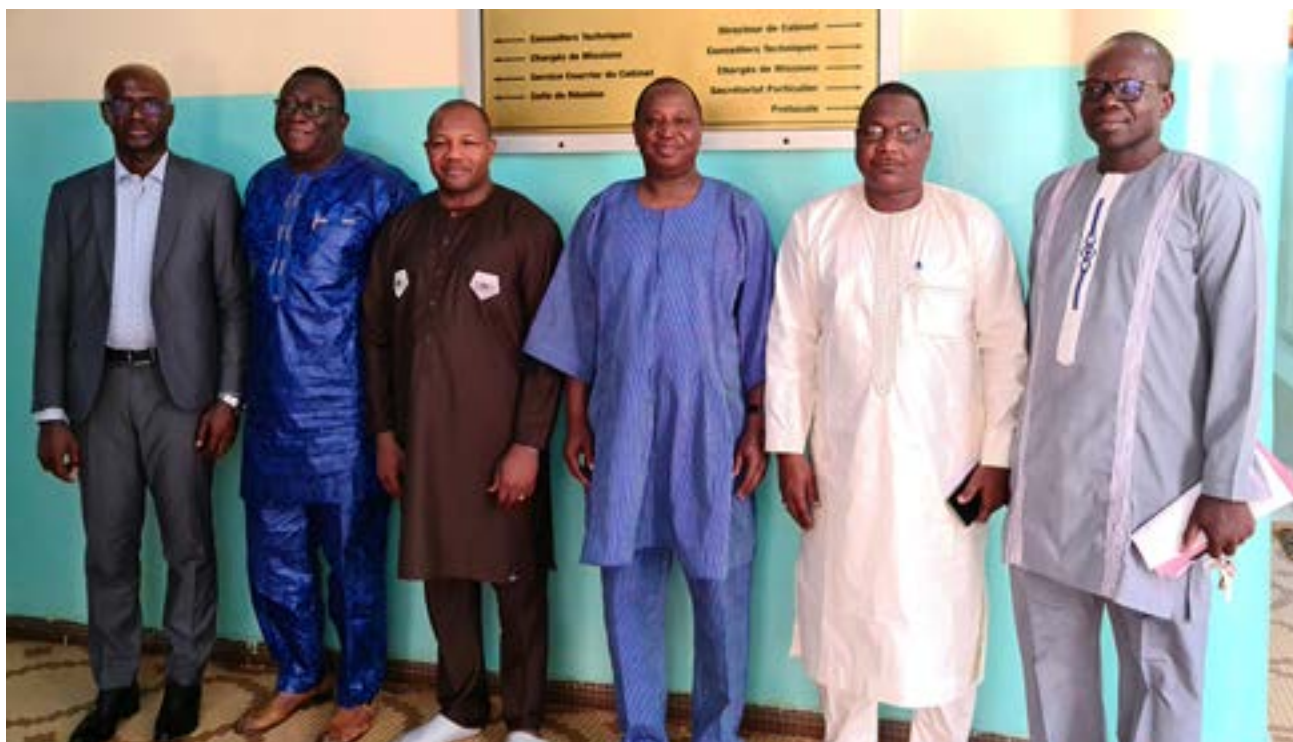
Photo de famille de la délégation du Secrétaire Général du CAMES avec le Ministre de l'Enseignement Supérieur, de la Recherche et de l'Innovation du Burkina Faso et ses collaborateurs.