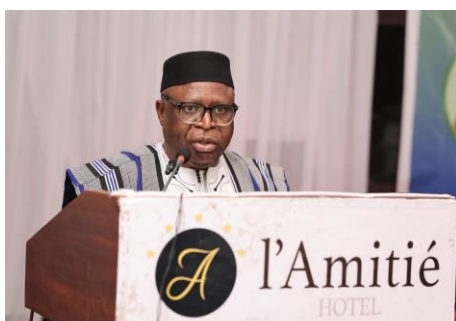
Pr Bouréma KANSAYE Ministre de l'Enseignement supérieur et de la Recherche scientifique du Mali