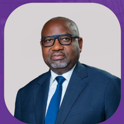
Pr Charles Edgar MOMBO

Président en exercice entrant du Conseil des Ministres du CAMES 2026-2027